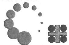
VSA Verband Schweizer Abwasser- und Gewässerschutzfachleute